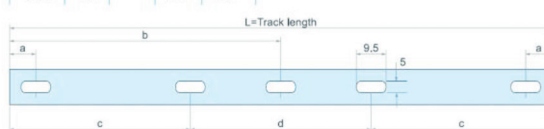
Punti di fissaggio