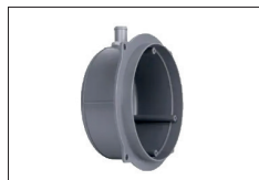
cod.PL195p Nicchia plastica per vasca in cemento