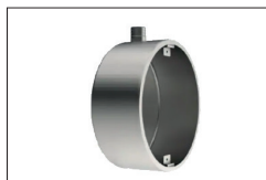
cod.PL195i Nicchia INOX per vasca in cemento