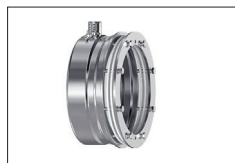
cod.PL195Li Nicchia INOX per vasca con telo