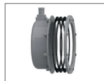
cod.PL195Lp Nicchia plastica per vasca con telo