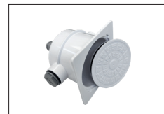
cod.PZ195p Scatola stagna di collegamento a pozzetto